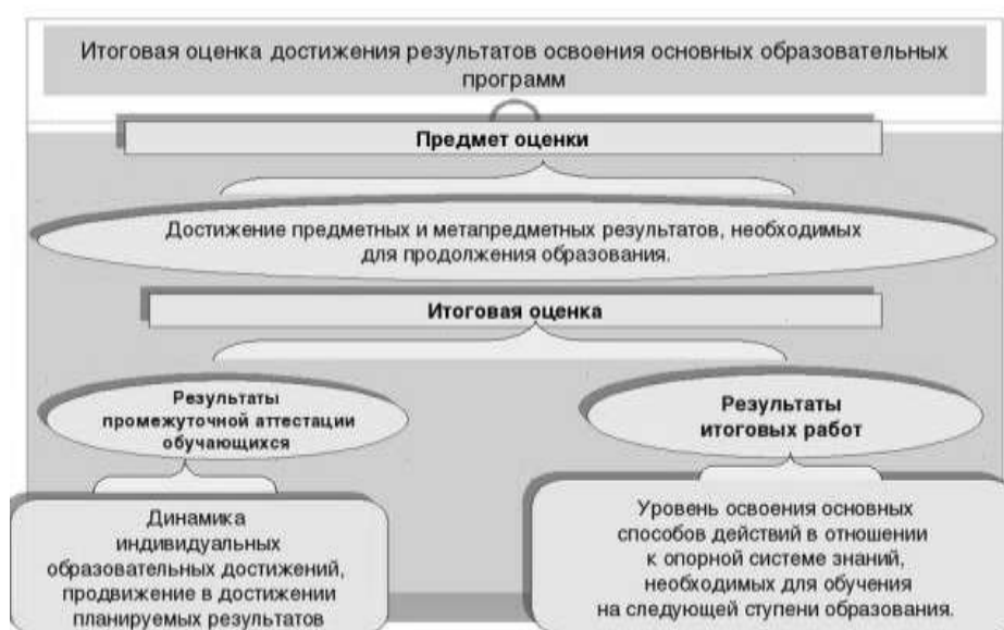
Рис. 3. Достижение предметных и метапредметных результатов, необходимых для продолжения образования. Итоговая оценка.

На итоговую оценку на уровне основного общего образования выносятся только предметные и метапредметные результаты , описанные в разделе «Выпускник научится» планируемых результатов основного общего образования.