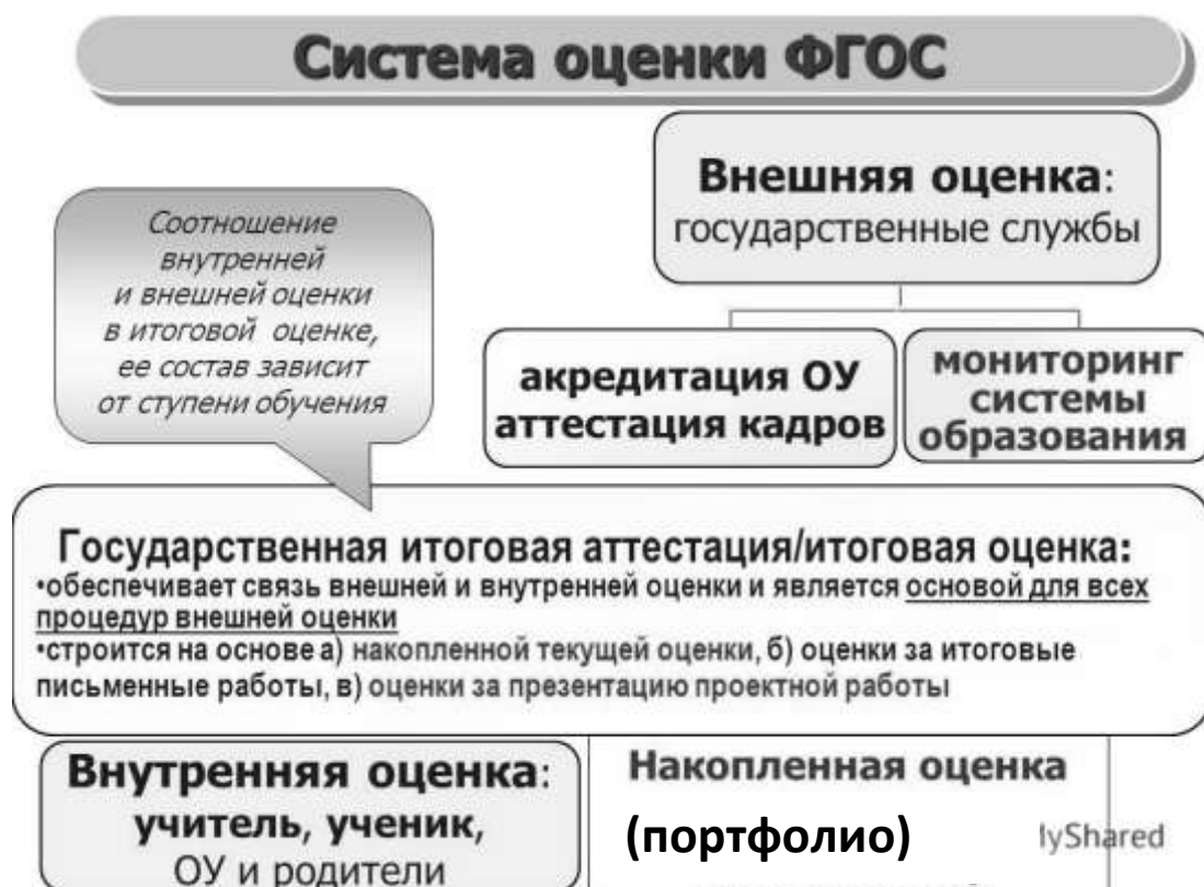
Рис. 2. Система оценки достижения планируемых результатов

В соответствии с ФГОС ООО основным объектом системы оценки результатов образования, принятой в МКОУ «АЛЕКСЕЕВСКАЯ ОСНОВНАЯ ШКОЛА № 4», её содержательной и критериальной базой выступают требования Стандарта, которые конкретизируются в планируемых результатах освоения обучающимися основной образовательной программы основного общего образования. Система оценки включает процедуры внутренней и внешней оценки.