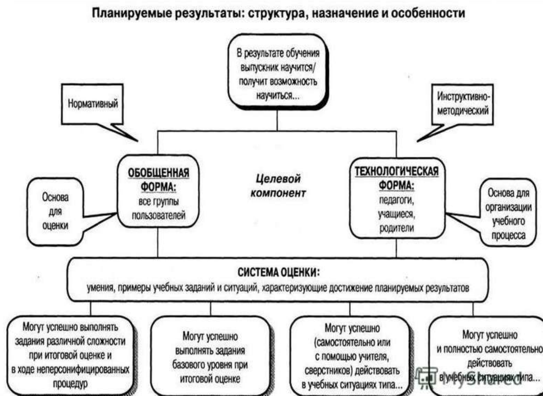
Рис. 1. Особенности структуры планируемых результатов. Функция и назначение.

4) обеспечивает оценку динамики индивидуальных достижений обучающихся в процессе освоения основной образовательной программы основного общего образования;